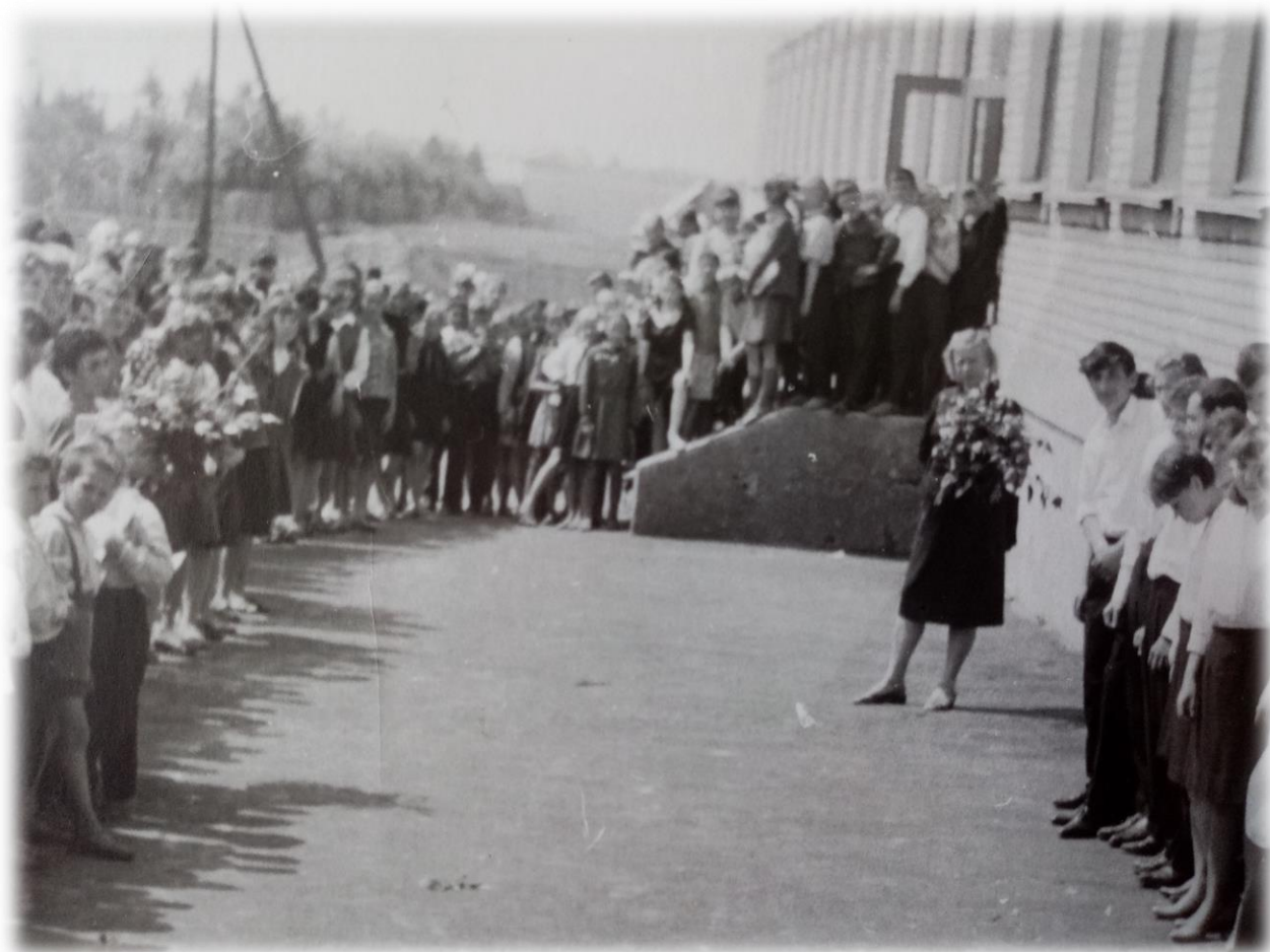
Фото 11. Линейка по случаю открытия новой школы