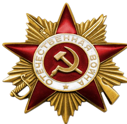
Фото 1. Награды героя