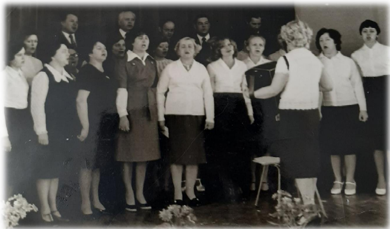
Фото 10. Хор сотрудников школы