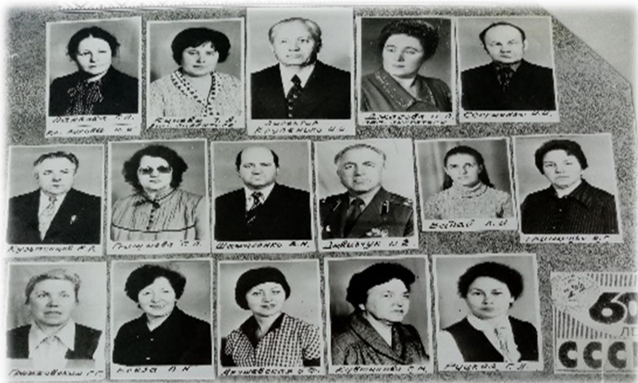
Фото 9. Первые учителя