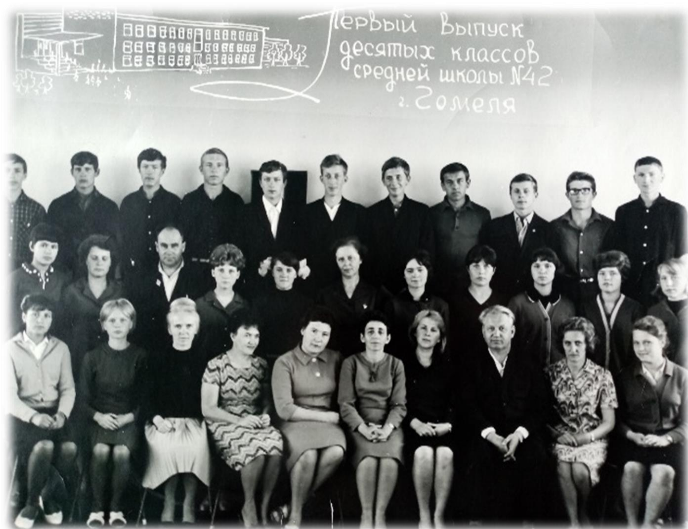
Фото 8. Первый выпуск школы